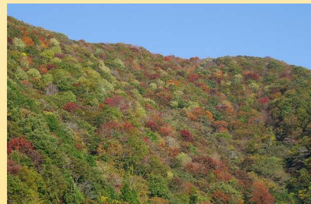
待避所NO.15(標高約742m) 撮影