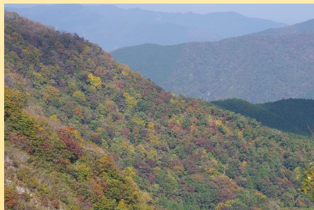
待避所NO.33(標高約994m) 撮影