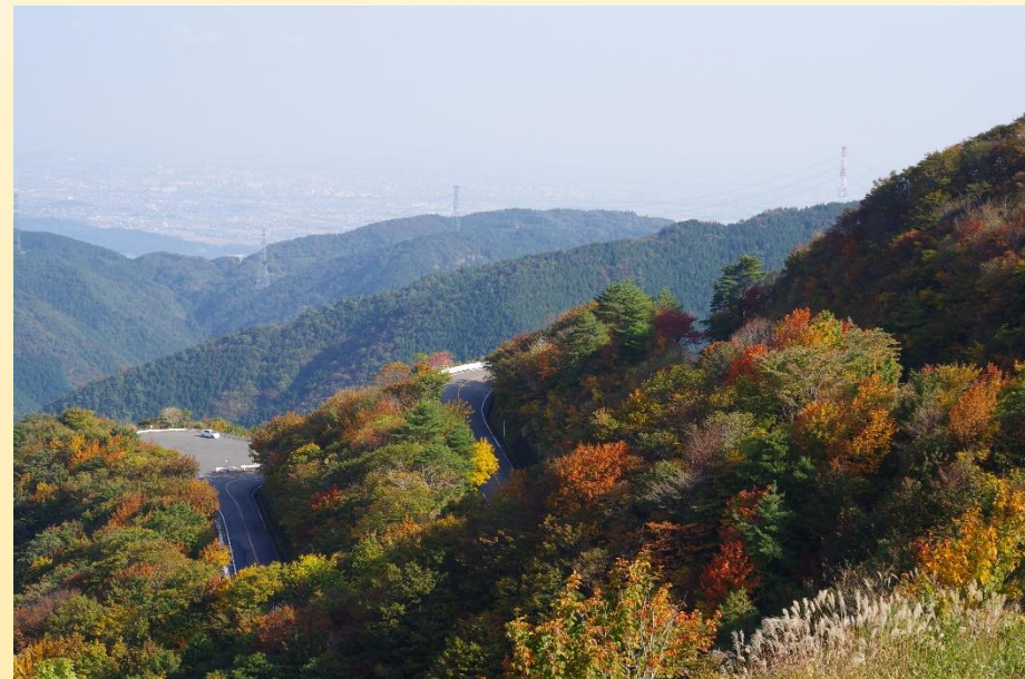
上平寺越駐車場(標高約900m) 撮影

今週は天候に恵まれ暖かい1週間となりました。現在、ピークを迎えた紅葉は標高約900mから約800m付近まで降りてきました。12k上平寺越駐車場からはダブルヘアピン(下方面)をご覧になると伊吹山ドライブウェイならではの紅葉をお楽しみ頂けます。