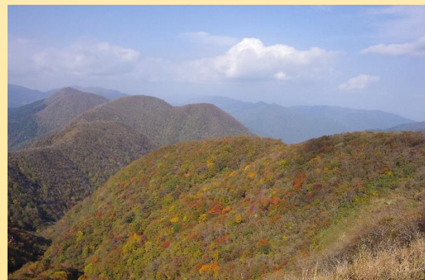
待避所NO.36(標高約1,094m) 撮影